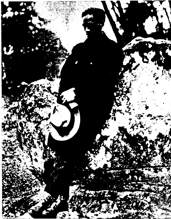
"No había otra cosa que conmoviera más a Vallejo, que le doliera más que la injusticia del mundo". El poeta en París, en 1937.

"Al principio yo era completamente anticomunista. Vallejo tuvo