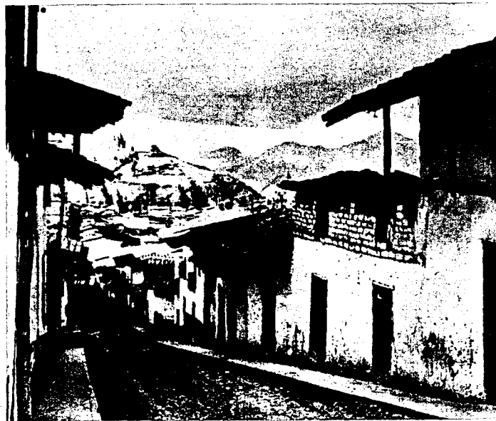
Santiago de Chuco, Perú, pueblo natal de César Vallejo.

"Creo en la predestinación. Cuando entré al colegio, tendría once años, como todas las colegialas, soñaba con mi príncipe encantado. Yo era un tonel, era monstruosa y la mitad de los profesores me consideraba inteligente y la otra mitad me tenía por una retrasada mental. Yo dibujé el perfil de mi futuro príncipe encantado y ese príncipe tenía treinta y cinco años, era sudamericano... y poeta. El perfil era exactamente el de