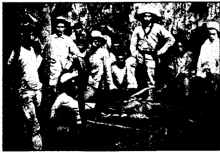
En 1893, España todavía controlaba perfectamente la situación cubana, ya cinco años antes se había firmado la Paz de Zanjón. Sería el 24 de febrero de 1895 cuando se iniciase el definitivo movimiento insurreccional conocido como el «Grito de Baire». (En el grabado, partida insurrecta preparando la comida en su campamento.)

No, al parecer no es posible la continuación de las relaciones coloniales, pero España tampoco puede consentir en la separación de la isla sin atender a tres cosas: a la suerte de Cuba después de su separación; a dejar suficientemente garantizadas las vidas y propiedades de los españoles que allí residen; y a que la separación se verifique sin desdoro de la honra nacional.