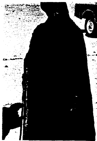
Saharai women's lib.