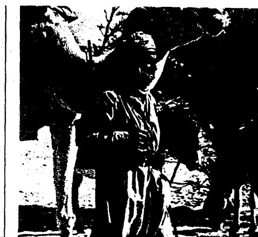
El mejor amigo del camello: el hombre.

ban enfrentarse directamente con España a pesar de la presión de algunos sectores de combatientes saharauis que querían llevar la lucha simultáneamente contra ambas potencias coloniales. En tales circunstancias, se produjo la rebelión de 1957, en las que las tropas españolas sufren duros reveses a lo largo de varios meses. El 12 de enero de 1958, El Aaiun es atacado por el ejército de liberación y la Legión experimenta numerosas pérdidas. Un mes más tarde, la situación se invierte favorablemente del lado español que, en una operación combinada con las tropas francesas, derrotan al ejército de liberación concentrado entre Bir Nazaran y Ausert. Para demostrar la decisión del gobierno después de tantos apuros, el Sahara e Ifni pasan a ser, por decreto, «provincias» españolas.