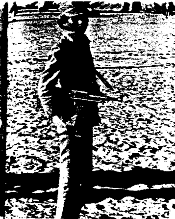
Milicianos de trece años.