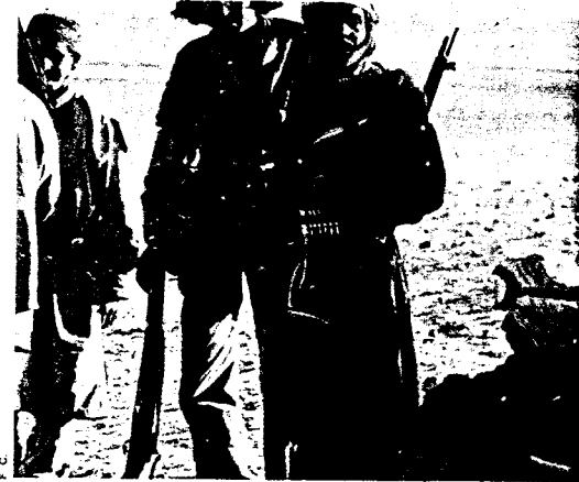
Ex vecinos de El Aaiún.