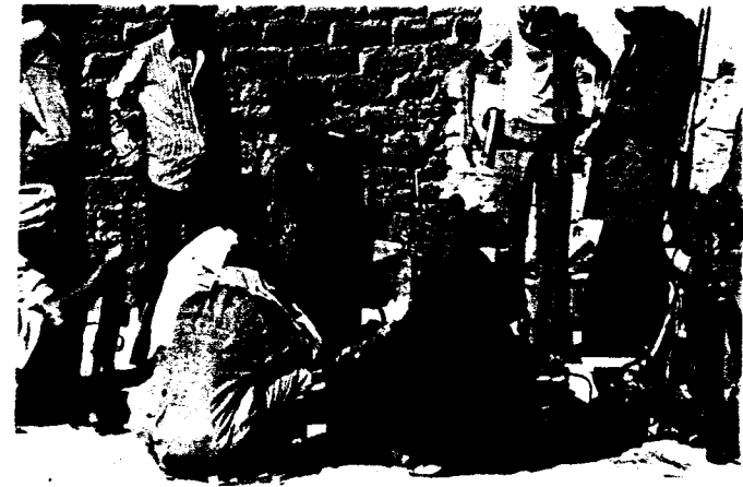
Polisarios en Mahbes.

general de la «provincia» del Sahara, se barajaba la hipótesis de que el recién nacido movimiento estuviera manipulado por Marruecos o Argelia, mientras que, en el Estado Mayor del ejército del Sahara, se apostaba decididamente por la tesis de que se trataba de un movimiento nacionalista saharauí, al margen de los intereses de los países vecinos.