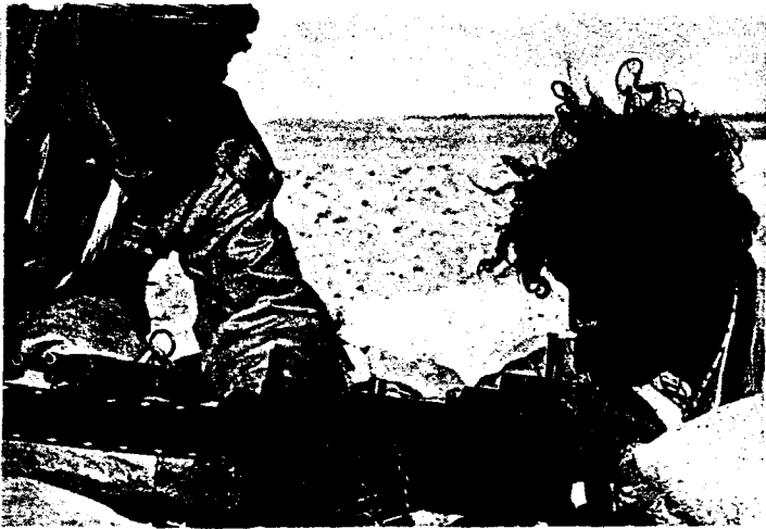
Veinte años de lucha armada.