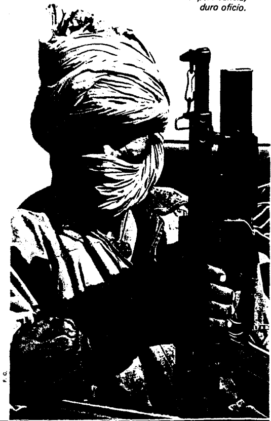
La supervivencia, duro oficio.

lítica y militar del nuevo, discutido y amenazado Estado, aunque pocas dudas cabían sobre su fuerza después de su irrupción en las calles de El Aaiun, precisamente ahora hace un año.