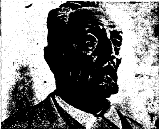
Unamuno, por el escultor Vitorio Macho y por el pintor Juan de Echevarria

Y hoy, ahora, pensamos, sentimos, con el filósofo, que también. Por la misma inquietud.